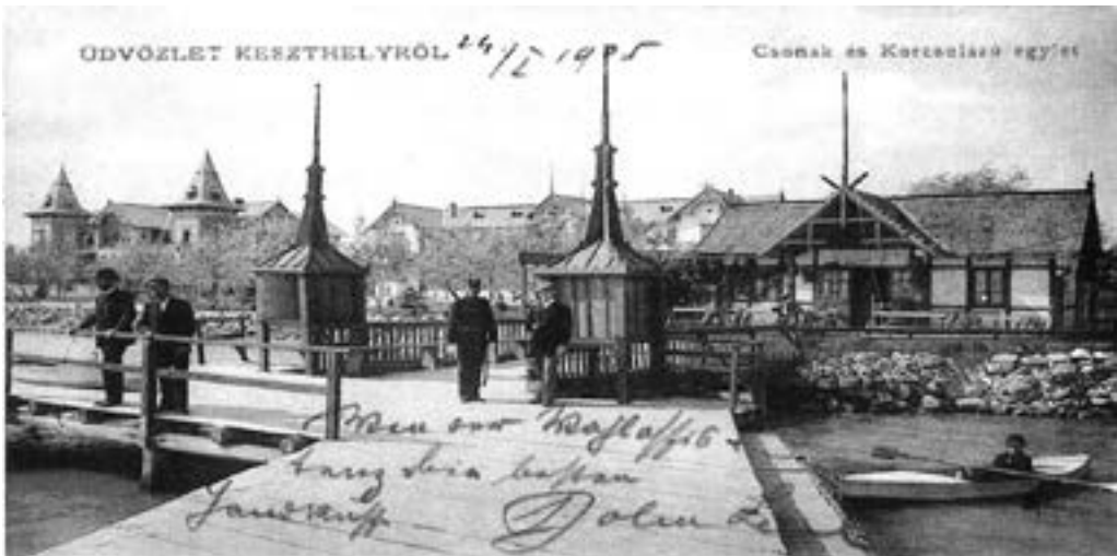
A KCSKE kikötője 1905-ből