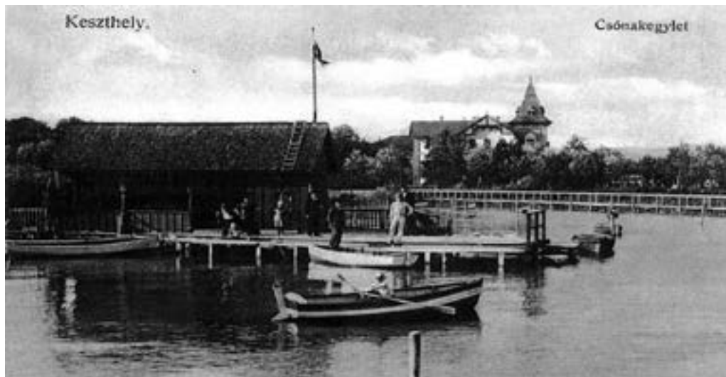
Csónakkölcsönző 1910-ből (B.M.)

Jól kezdődött 1914, a két évvel korábban megalakult Balatoni Yacht Club felvette tagjai közé a Keszthelyi Csónakázó és Korcsolyázó Egyletet, így már indulhattak a BYC rendezvényein.