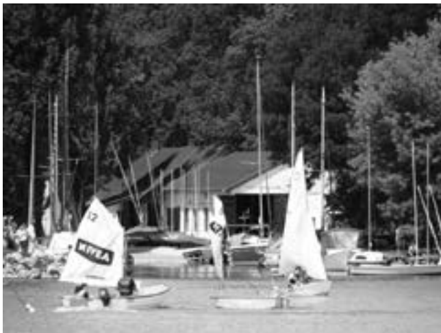
Edzés a klub előtti öbölben (KYC)