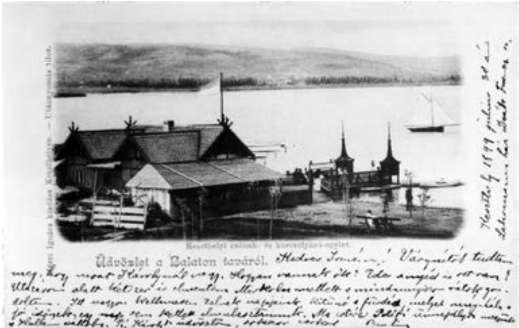
A Keszthelyi Csónakázó és Korcsolyázó Egyesület épülete (B.M.)

A csónakház avatásakor 1900-ban már gazdaságilag erős az egyesület. A megalakuláskor felvett kölcsönöket teljes egészében visszafizették, építettek még egy nagyméretű pavilont. Hajóleltárukban: 22 db csónak, 21 db szandolin szerepelt, tagságuk 160 főre emelkedett, ami tovább bővült a Gazdasági Tanintézet Atlétikai Club 80 fős tagságával, 60 koronás éves tagdíjjal a KCSKE-be is beléphettek.