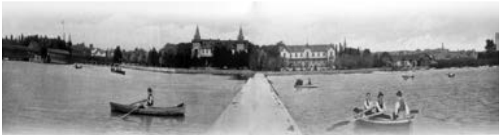
A Hullám Szálló és a Balaton Szálló a mólóról, jobbra a KCSKE épülete. (KYC)

A tagok saját maguk által nyújtott kölcsönökkel tették lehetővé a csónakház és az első csónakok megépítését. A munkák elkészültéig a Polgári Csónakházból kölcsönzött csónakokban gyakorolták az evezést és rendezték az első házi versenyeket. Az elkészült csónakházban nagyterem, öltöző, műhely és toalett kapott helyet. Az „L” alakú épület a mai játszótér előtti szakaszon meghatározta a vízpart hangulatát. A kikötő híd két oldalán fából kialakított tornyos épületekben rendezvények alkalmával a pénztárosok dolgoztak.