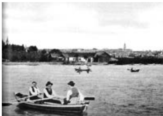
A Keszthelyi-öböl csónakázókkal és a klub épületével.