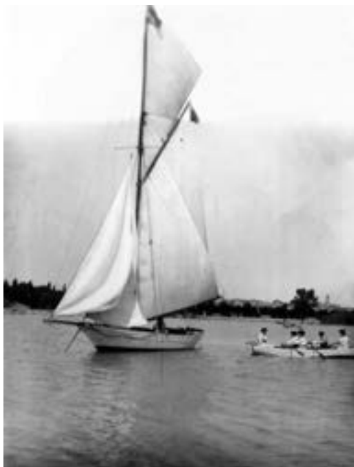
A Festetics család vitorlása